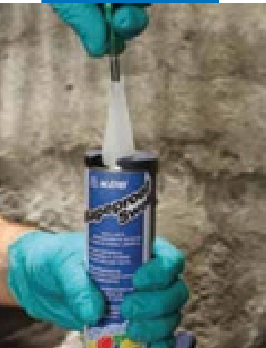
Прокалывание защитной мембраны на трубе Marerproof Swell