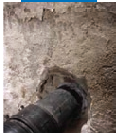
Mapeproof Swell после нанесения

Содержащиеся в настоящем руководстве указания и рекомендации отражают всю глубину нашего опыта по работе с данным материалом, но при этом их следует рассматривать лишь как общие указания, подлежащие уточнению на практическом опыте. Поэтому, прежде чем широко применять материал для определенной цели, следует проверить его на адекватность, предусмотренному виду употребления, принимая на себя всю полноту ответственности за последствия, связанные с применением этого материала.