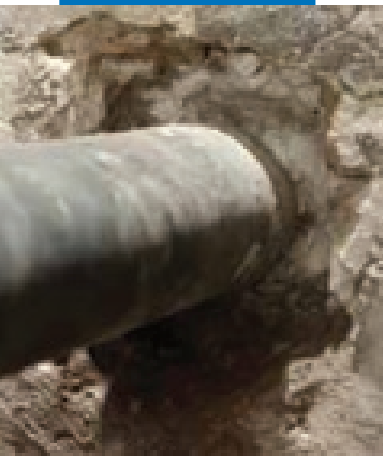
Выполнение штрабы вокруг трубы