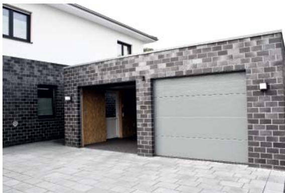
ПАРКОВКИ / ГАРАЖИ