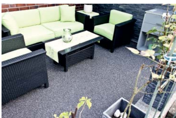
ОФИСЫ / ТОРГОВЛЯ И УСЛУГИ