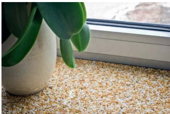
ПОДОКОННИКИ / СТОЛЕШНИЦЫ