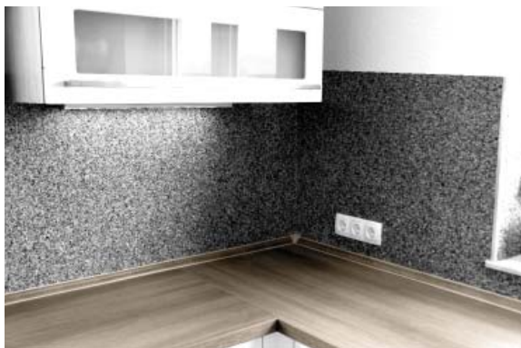
ВАННЫЕ / КУХНИ