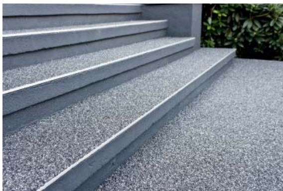
ЛЕСТНИЦЫ / ТЕРРАСЫ