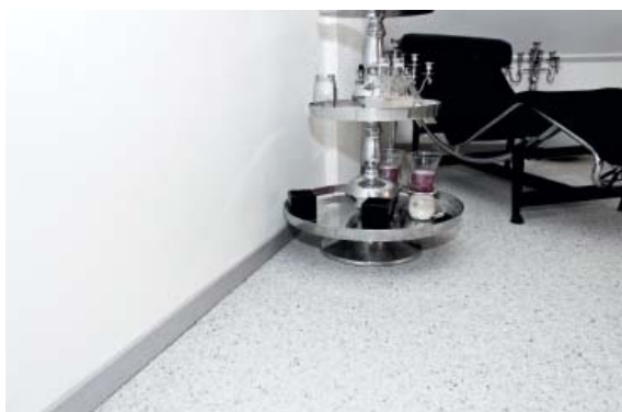
ХОЛЛЫ / ГОСТИННЫЕ